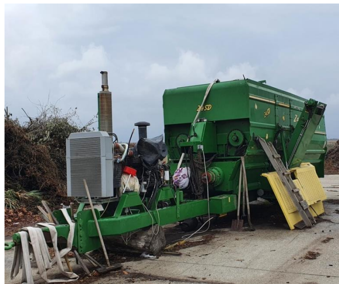
Снимка №3 Шредер за зелени отпадъци

Съоръжението за компостиране е разположено на територията на Регионалната система за управление на отпадъците -с. Вълген. То използва част от спомагателната инфраструктура на депото - вход, везна, огради, вътрешен път, външно осветление, противопожарни