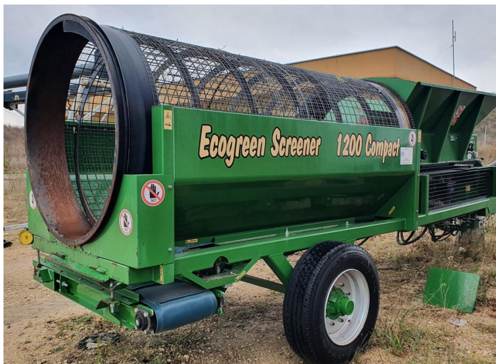
Снимка №4 Сито за пресяване на компост

След изтичането на шест седмици, отпадъците, които остават в куповете, се отстраняват от тях с помощта на челен товарач. Товарачът захранва мобилно барабанно сито (Снимка №4) за пречистване на компоста, за да се разделят останалите примеси в стабилизираните отпадъци (пластмаси, органична фракция, която не е биоразградима, и т.н.).