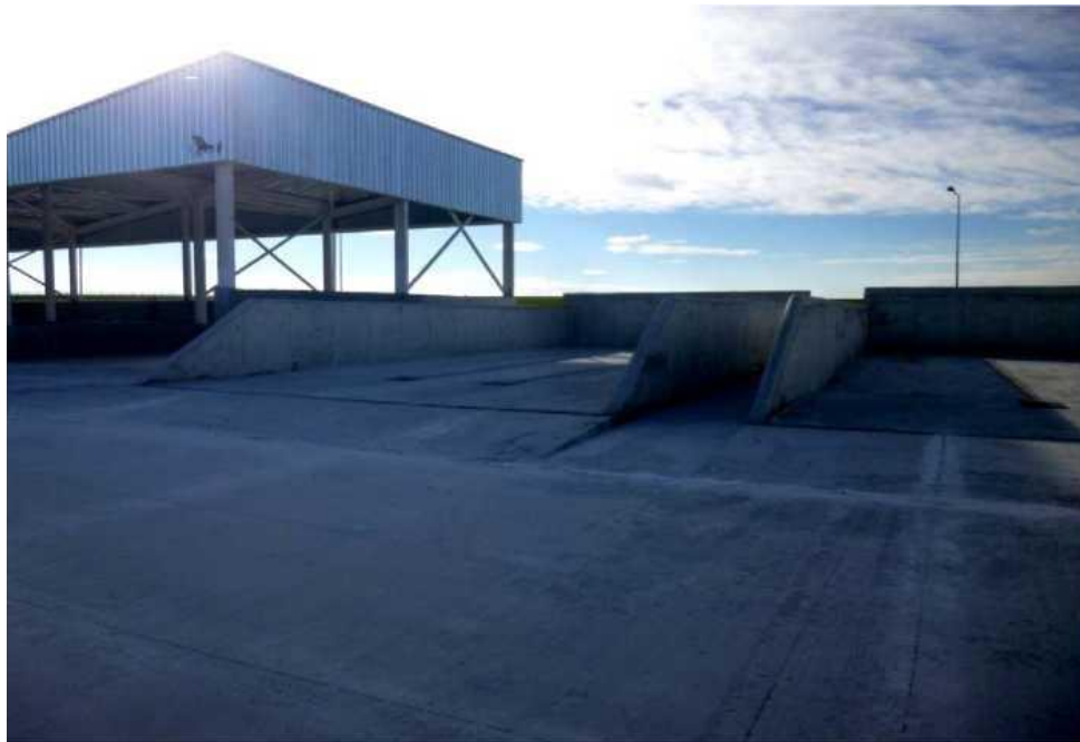
Снимка №1 Площадка и съоръжения за компостиране

При проектирането на съоръжението за компостиране за Регион за управление на отпадъците - Варна е взето предвид, че останалата част от органичните отпадъци от общия поток на Община Варна ще бъде третирана в предприятието за МБТ Инсталацията - с. Езеро, Община Белослав. Растителните биоотпадъци се доставят ежегодно до инсталацията. На площадката има шредер за раздробяване на дървета и клони (Снимка №6), както и миксер (Снимка №5). По този начин се постига намаляване на обема на отпадъците и подготовката им за ефективно компостиране.