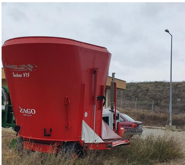
Снимка №2 Миксер за зелени отпадъци

При проектирането на съоръжението за компостиране за Регион за управление на отпадъците - Варна е взето предвид, че останалата част от органичните отпадъци от общия поток на Община Варна ще бъде третирана в предприятието за МБТ Инсталацията - с. Езеро, Община Белослав. Растителните биоотпадъци се доставят ежегодно до инсталацията. На площадката има шредер за раздробяване на дървета и клони (Снимка №6), както и миксер (Снимка №5). По този начин се постига намаляване на обема на отпадъците и подготовката им за ефективно компостиране.